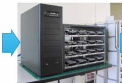
スクリーニング試験装置